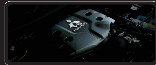
ĐỘNG CƠ GASOLINE V6 3.0 MIVEC Động cơ 06 xy-lanh V6 đẳng cấp cho khả năng vận hành mạnh mẽ, êm ái và tiết kiệm nhiên liệu với công nghệ điều khiển van biến thiên điện tử MIVEC.