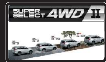
Hệ thống truyền động 2 cầu