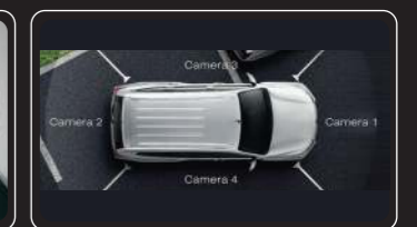
Camera quan sát quanh xe