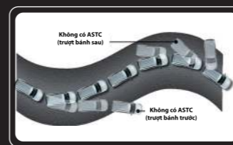
Hệ thống cân bằng điện tử kiểm soát lực kéo ASTC