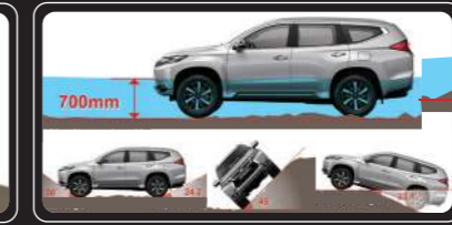
Khả năng vượt địa hình vượt trội