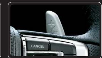
Lẫy sang số