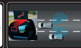
Cảnh báo điểm mù