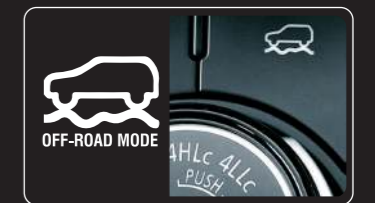
4 chế độ vận hành off-road