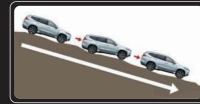
Hỗ trợ xuống dốc (HDC)

Chi chú: Hình ảnh minh họa có thể khác biệt với thực tế