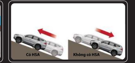
Hỗ trợ khởi hành ngang dốc (HSA)